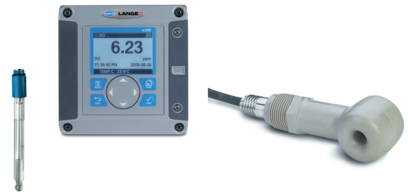
Controller und Sensoren für die Onlineanalytik sowie Regler für die kostensparende Prozessoptimierung