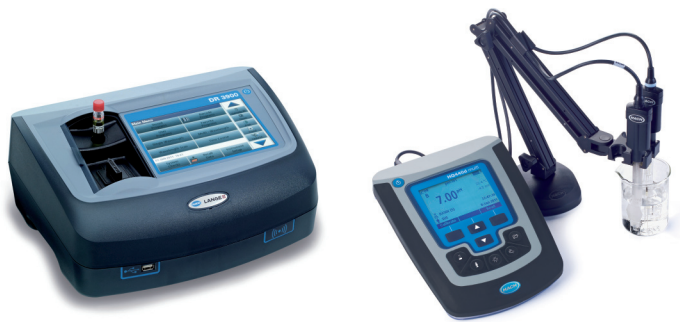
Labor- und tragbare Geräte für die Laboranalyse, mit speziellen Tests für Galvanikbäder Instandhaltung und Gerätequalifizierungsdienste verfügbar

* Für weitere Parameter und Lösungen kontaktieren Sie bitte Ihren HACH LANGE Vertreter vor Ort oder besuchen unsere Website.