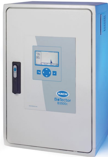
Die Hach BioTector B3500c TOC-Analysatoren bieten durch ihr patentiertes Zweistufiges Oxidationsverfahren eine maximale Betriebszeit und Zuverlässigkeit.

Selbst Probleme, die zunächst banal erscheinen mögen, wie undichte Verschlüsse oder leckende Leitungen, können schwerwiegende Folgen haben. Dazu zählen Geräteschäden, verminderte Effizienz, Bußgelder durch die Verletzung von Auflagen und selbst ein Prozessstillstand. Die Hach BioTector B3500c Analysatoren sorgen dafür, dass Probleme frühzeitig festgestellt und identifiziert werden. Dadurch helfen sie Endverbrauchern dabei, schwerwiegende Probleme zu vermeiden.